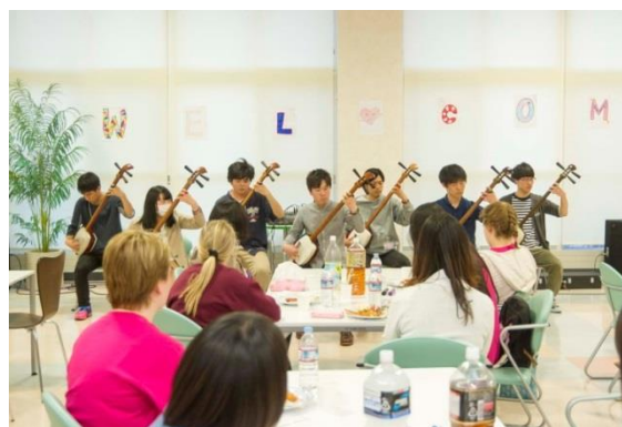
(歓迎会三味線サークルの余興)