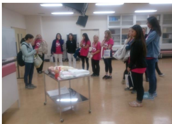
(学内キャンパスツアーの様子)