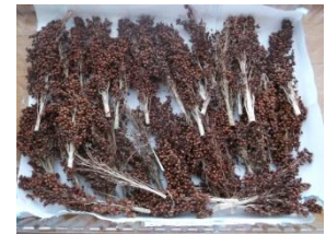
図 1. 深浦産タカキビ

わが国の糖尿病の患者数は境界型を含めると約 2200 万人と推定される 1) 。本県においても糖尿病の予備群も含め多数と考えられる。それゆえ、「健康あおもり 21 (第 2 次)」において糖尿病の発症と重症化予防の徹底は、重要な施策となっている 2) 。糖尿病が進行するとインスリン抵抗性の増大に加え、これと合併する脂質異常症が、心血管疾患の発症をさらに高めるリスク因子となることが知られている。したがって、脂質異常症の改善は、高血糖症にともなう心血管疾患を減らすことができるとされている。