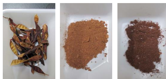
A B C

多くの生活習慣病と肥満の関連が指摘されるようになり、脂質の吸収抑制や体内の脂肪減少に役立つ食品成分が注目されている。我々は青森県野辺地町が特産化を進めているカワラケツメイ ( Cassia mimosoides , 図 1) の生理作用を検討し、これまでにアルコール性肝機能障害や肝臓への脂質蓄積をカワラケツメイが軽減する可能性を見出した 1) 。