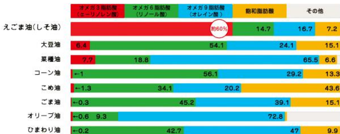
図2 おもな食用植物油の脂肪酸組成