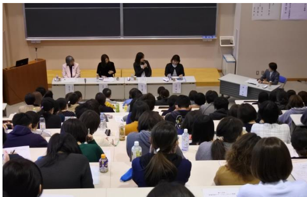
シンポジウムの風景