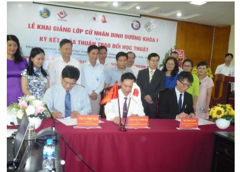
青森県立保健大学、ナムディン看護大学、ベトナム国立栄養研究所との調印式

ベトナム、ナムディン看護大学との学術・教育交流協定が結ばれたことにより、ベトナムの学生や教員のみならず、日本側からの国際交流を希望する学生や教員にとっても新しい展望の見える交流の第一歩が記され、これからの発展が期待される。