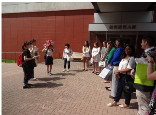
キャンパスツアー（ねぶたの花笠紹介）