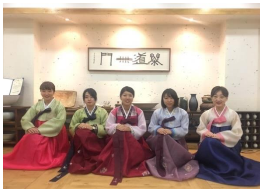
韓国文化・朝鮮服の体験