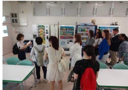
キャンパスツアー開始