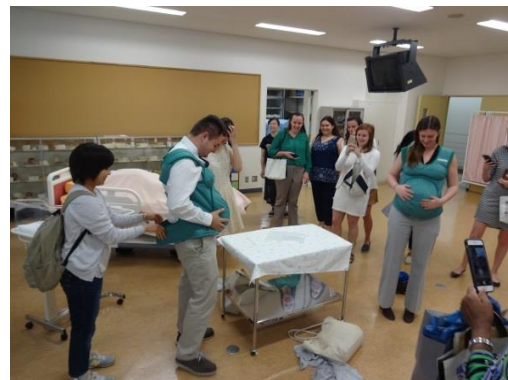
キャンパスツアー（妊婦体験モデル着用）