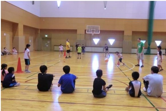
(キックベースボールの様子)