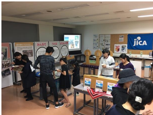
世界の食糧事情展示に興味津々