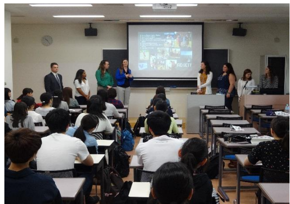
ベレノバ大学研修生による プレゼンテーション