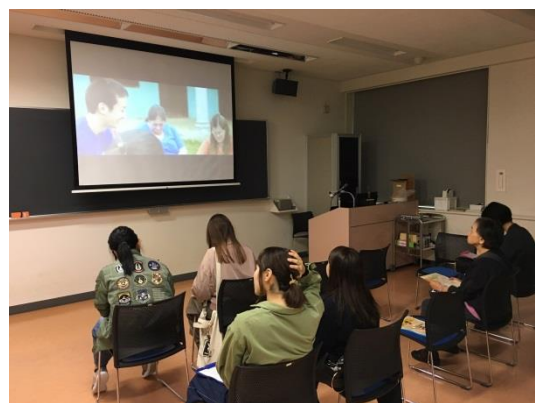
世界で活躍する日本人の紹介