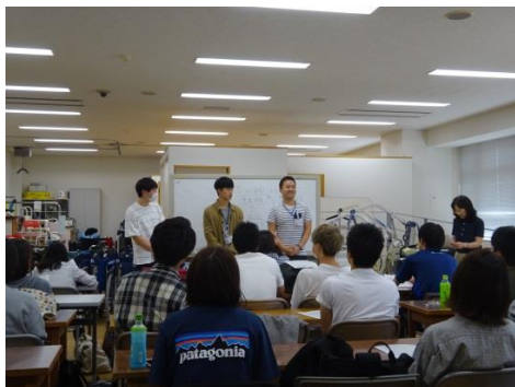
最初日の自己紹介