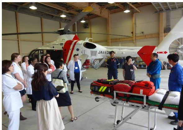
ドクターヘリの見学

「交流事業報告書 青森県立保健大学・ベレノバ大学 2018」を作成した。報告書は研修内容の詳細、交流に参加した本学の学生やベレノバ大学研修生らの生の声を載せた内容となっている。詳細は報告書をごらん頂きたい。