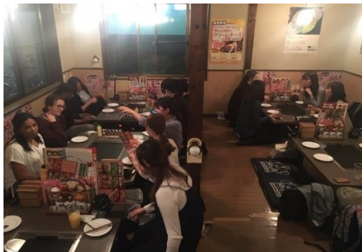
歓迎会（お好み焼きを焼きながら）

学生は自分自身の英語力向上や海外で暮らす人々と交流してみたいなど、それぞれの動機をもとに主体的に活動していた。今回の経験を通じ、自分自身の欠点であった積極性を克服できた、自分に自信を持つことができたと評価した学生もみられ、有意義な経験であったのではないかとと思われる。