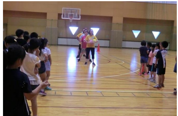
(トンネルボールの説明)