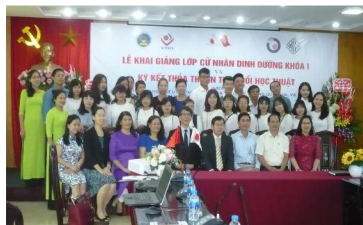
新生(17名参加うち男子3名)と先生方