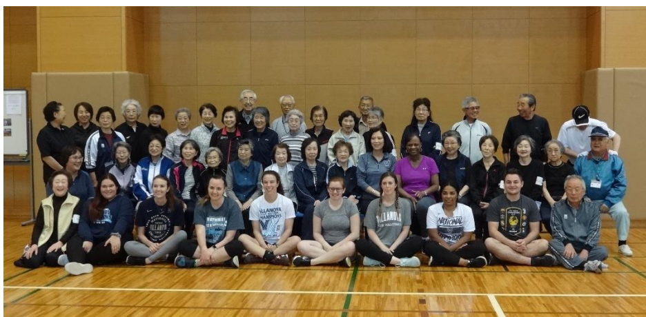
「杖なし会」の皆さんと記念撮影