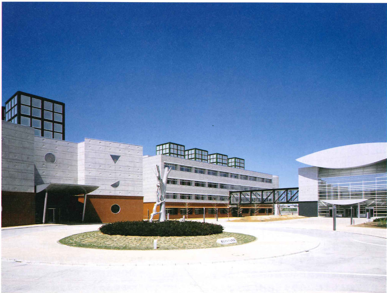
左から管理図書館棟、教育研究B棟、講堂