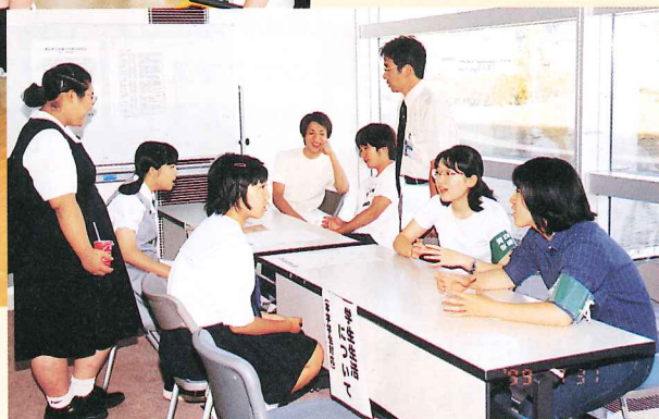
(進学相談コーナー)