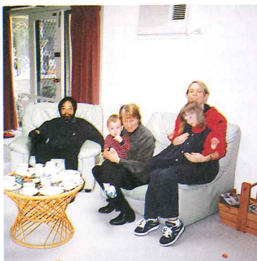
典型的なホームステイ先の家族 (2人の幼児と左はノエル教授)