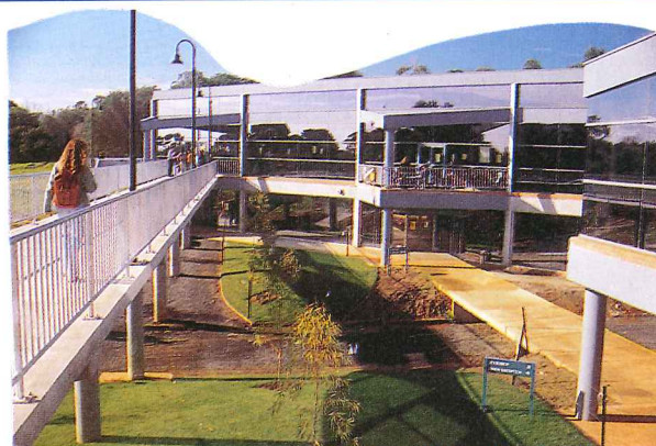
集中英語コースが行われる モナシュ大学ベニンシュラ・ キャンパス

7つのキャンパス、11の学部、47,000人の大学人口を擁するモナシュ大学は、海外の約60の大学と国際交流を行っているが、アジア諸国からの留学生のための各種プログラムの企画、マーケティング、調整、管理はAACE(Australia-Asia Contact in Education)が行っている。1991年の設立以来、既に4000以上のプログラムを成功させているという。我々がAACE事務局を訪問した際に紹介された15、6人のスタッフ中5人は日本語と日本文化に通じたbilingualであった。良質のホームステイ先の確保を専門に行っているスタッフもいた。