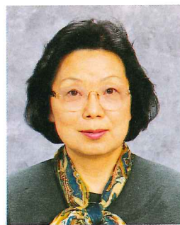
青森県立保健大学学長