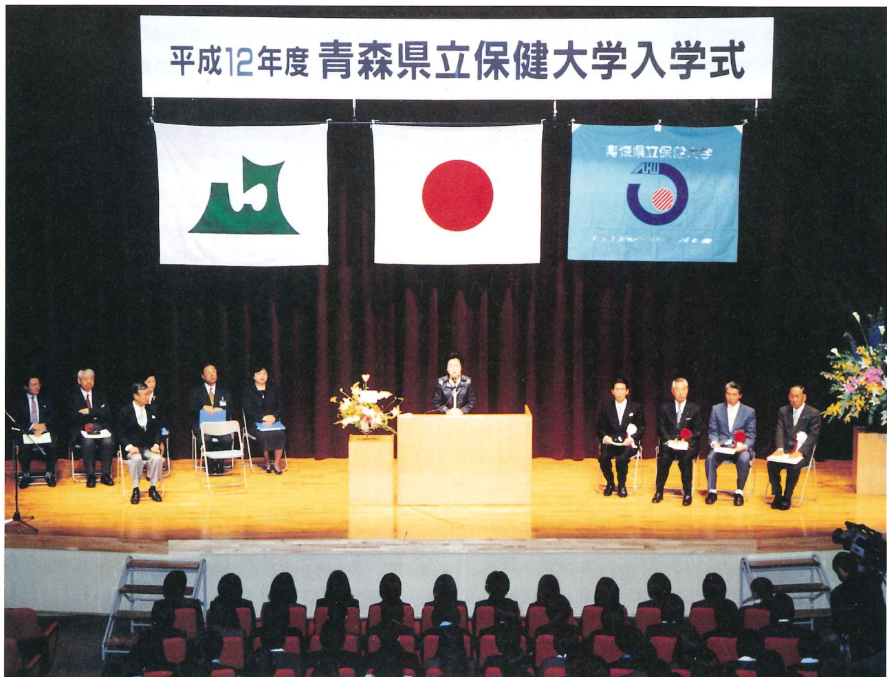
平成12年度青森県立保健大学入学式