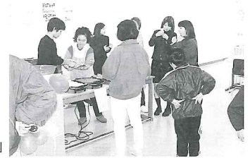
大学祭における「ホットドッグ等販売」