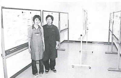
大学祭における「北海道・東北スキー場情報」展示