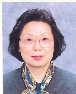
青森県立保健大学学長