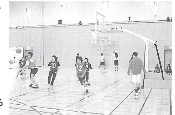
大学祭における「3ON3大会」