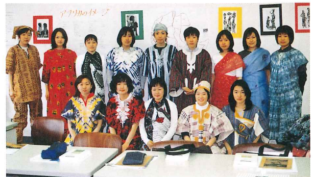
アフリカの民族衣装を着てみた学生たち

本大学の3学科の1年生を対象とした人間総合科学演習では、開発途上国の「貧困問題」を考えるために、アフリカを材料に、異文化を理解する心、他者を受け入れる心、そして人間を理解する心の開発を狙いにしている。この演習を希望して履修している学生だけあって、学習意欲、参加意欲は高く、学生の演習に対する評価も肯定的である。演習終了後の「ゼミ論集」は、この演習で身につけた事をいつも思い出して欲しいという願いを込めて作成している。