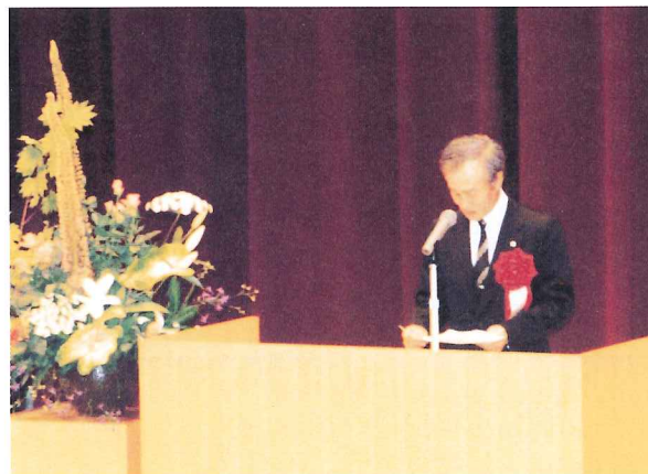
平成11年6月、開学記念式典

開学の準備のため、日々奔走されていたお姿が今も臉に焼き付いています。本当にお疲れさまでした。