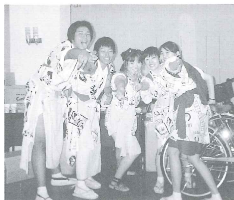
ねぶた祭りの後で