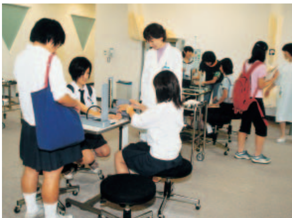
オープンキャンパスにおける血圧測定風景