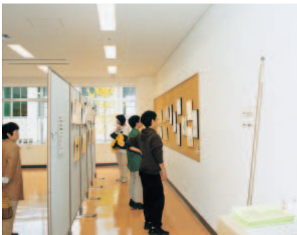
ハンセン病関連のパネル展示室の様子