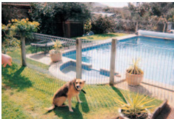
ホストファミリーの庭、大きなプールと利口なベンソン(犬)

褒めるという事はその場の雰囲気や和やかにしてくれると思う。そして家族の絆を確かめる最大のコミュニケーションだと私は考える。