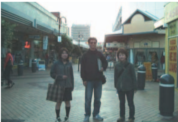
キャンパス近くのショッピングモールにて

大学で行なわれたさよならパーティーや、帰りのバスの見送りには、多くのホストファミリーが駆けつけてくれました。特にホストファミリーの小さい子どもたちは別れるのが嫌で泣きじゃくっていました。たった3週間でしたが学生たちは家族の一員として生活し、いい体験をすることができたんだなと感心しました。