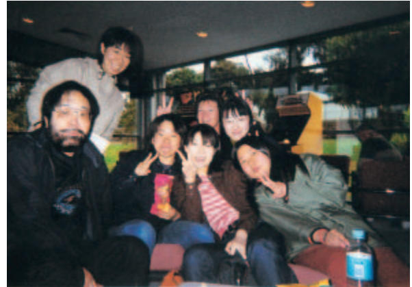
みんなニコニコ (左端筆者)

昨年の4週間が今年は3週間に減らされてしまったため、その辺のギャップをどうやって埋めるべきかで頭を悩ませた。2単位の選択科目である English Communication の授業時間数は60時間と決められている。そこで週2回の割合で行われる病院等の施設見学や Field Trips の時間の一部を課外授業と見なすことによってなんとかクリアした。問題は学生達がどのくらい早く異文化に適応してくれるかである。昨年は3週間たってもまだカルチャーショックから脱出できず、ホームステイ先での意志の疎通もままならないでいる学生がいた。スタートに問題はなかったか、と考えてみた。昨年の場合メルボルン到着が日曜で、ホストファミリーとはその日の午後、それも旅の疲れを引きずったまま過ごただけ。翌朝から早速授業が始まり、週末までホストファミリーとゆっくり話すチャンスがなかった。これがよくなかったのかもしれない。そこで今年は青森出発金曜日、メルボルン到着土曜日という旅程を組んでみた。そ