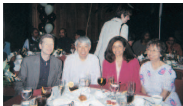
ガバナズ州立大学院教授と（卒業記念パーティにて）