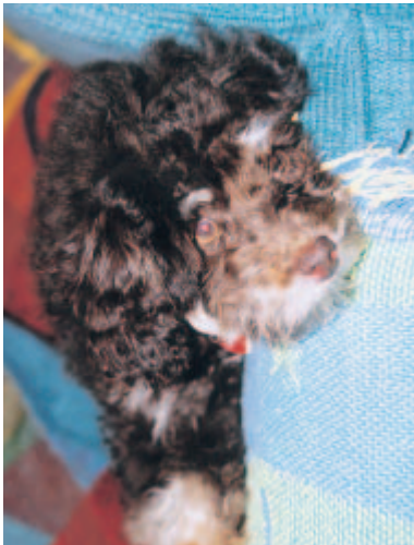
ホストファミリーが飼っている“カブチーノ”約2歳 皆彼女のことを“チノ”と呼ぶので私が返事をしてしまい大笑いでした

体験談を聞くことはおもしろいであろう。しかし、私はぜひ多くの人に自らの生の体験をし、3週間で得られるものの多さを実感して欲しいと思う。