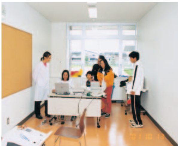
多くの人が興味を示した骨密度測定

またこの大学祭では、「わ」や「協力」と共に、自身の「成長」も感じる事ができたので、ここに記したいと思います。私は広報担当として、広報活動の仕事を課されました。具体的には、企業の広告を大学祭のパンフレットに掲載する代わりに、その広告の大きさに応じた協賛金を頂くという仕事です。高校の学園祭にはそのような仕事は無かったため、初めは自分の役割に不安を感じましたが、それと同時に少しずつ社会人に近づいているような、嬉しい実感もありました。広報活動は夏休みから開始したわけですが、企業訪問時はもちろんスーツ着用なので、入学式以来の正装に心まで引き締まる思いがしました。予め電話でアポイントメントを取ってから、企業訪問をして協賛金を頂くという仕事をできるだけ繰り返します。一見簡単そうな仕事ですが、今の自分と広報活動前の自分を比較してみると、少しは成長している