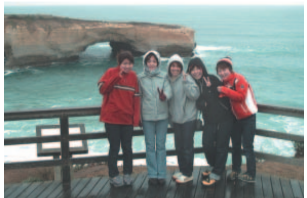
ものすごく寒かったけどきれいだっGreat Ocean Road

昨年より1週間少ない日程でしたが、「今までの何年分にも匹敵する3週間でした。」とある学生が言っていたように、学生全員それぞれにとってきっと内容の濃い充実した3週間だったのだろうと思いました。【私にとっては、思っていたより寒くて（聞いてはいたのですが）学生からの「風邪を引いた」との報告にドキドキした3週間でした。】