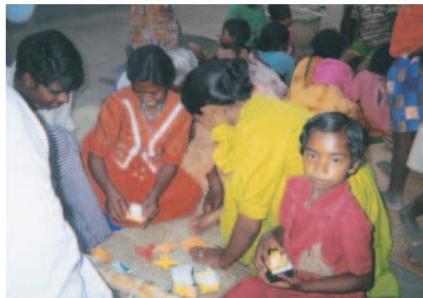
農村での折り紙作り

この旅を通して、先進国と発展途上国の大きな差を感じた。医療にしても、教育にしても、先進国の助けがなければ成り立っていないものが多い。しかし、いずれ発展途上国は一人で立ち上がり、生きていかなければならない。そのためにも、先進国がただお金や物を送るのではなく、その国にあった技術提供をし、国の人々も学んでいかなければならないと思う。