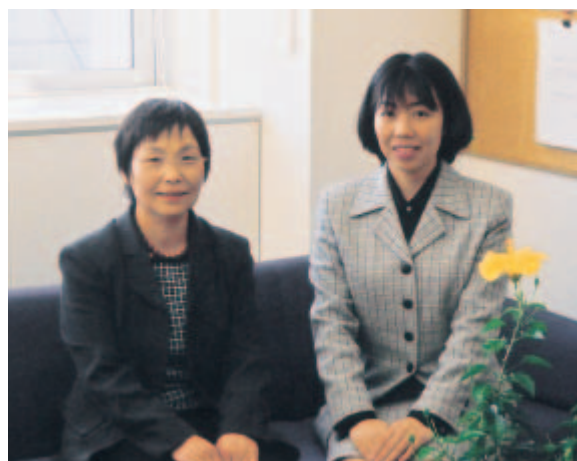
向かって左から露木助教授、加賀谷助手