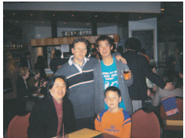
楽しくも悲しいお別れ会

この度の留学は、私にとって初めての海外ということもあって、短い間でしたが得ることはたくさんありました。そして、とても楽しむことが出来ました。例えば、英語はもちろんのこと、一部でしたがオーストラリアの医療・保健・福祉分野のことを知ることが出来たことは、今後の日本での勉強に役立つ要素が多分にありました。オーストラリアは、日本と同じ様な問題を抱えていたり、日本より進んでいるところ、日本にはない部分など得るところはたくさんありました。これ以外にも、いろんなことを学ぶことが出来たのは、ホストファミリーを始めとするオーストラリアの方達と日本の先生方のお陰です。その方達がいなければ、今回の留学は成功し得ないと感じたし、感謝したいと思いました。特に、ホストファミリーの方達には、オーストラリアの文化や自然を知ることが出来た上、今まであまりしたことがなかった「魚釣り」を体験して、楽しみを得ることが出来ました。その「魚釣り」を通して、オーストラリアの自然の広大さ・偉大さを感じることが出来ました。その広大さは、オーストラリアの方々にも通じて感じる事が出来ました。それは、オーストラリアの大半は移民の方であるからです。今回は、他の大勢の友達と海外に来ましたが、今後機会があれば、少人数若しくは個人で海外を旅したいと思った。なぜなら、海外経験は前述してあるように得ることは多分にあるし、自分の視野が広がることなど、私にとって有機的な効果を与えてくれるからです。最後に、オーストラリアに行って、日本の大事さも感じる事が出来たのは、良かったと感じました。