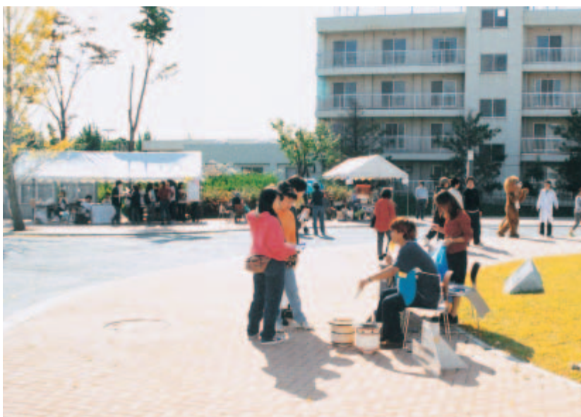
社会福祉学科2年生による焼き鳥販売