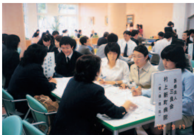
就職合同説明会(9月)の様子 場所：保健大学C棟1F「コミュニティーホール」

今後とも、開学の趣旨を大切にしながら就職対策に取り組むことにしていますので、更なる協力を願うものであります。(平成14年10月30日)