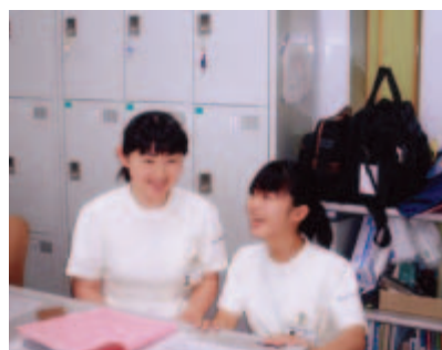
写真③ 訪問看護ステーションで楽しく実習しています。

大学を離れての実習で不安もあったようですが、市町村や訪問看護ステーションでは1～2人という少人数で実習したので細かな部分まで指導してもらえて、楽しくできたようでした。(写真③)