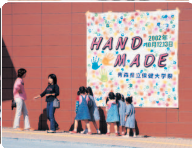
第4回青森県立保健大学祭・テーマ「HAND MADE」