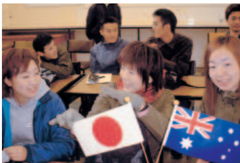
日豪親善の一翼も担ってます