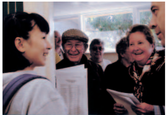
ホストファミリーと御対面

As an 'English Communication' program, realis-