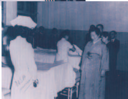
第二次世界大戦後、モデルスクールに香淳皇后陛下御訪問