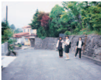
写真②/地区診断「ここはどんな町だろう？」

また「地区診断」という“地域を知る”ために学生が町内を回って住民から話を聞き、より深く地域というものを理解する実習も行いました。(写真②)