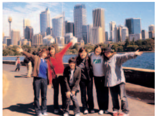
シドニーの高層ビル

この海外研修は、将来看護師になるために学んでいる私にとっても大きなものをもたらしてくれました。その最も大きな出来事は、ナーシングレクチャーで解剖された臓器を実際に触れて勉強できたことです。やはり多少は恐怖心もありましたが、こうして将来医療の道へ進む学生たちのために勉強して欲しいと自分の体を提供してくれる人があるのだと感じ、その人達への感謝の気持ちで胸がいっぱいになりました。自分が進もうとしている道の責任・その仕事の役割を改めて考え、今まで壁にぶつかると弱音をはいていた自分が恥ずかしくなりました。このオーストラリアでの経験を糧に、これから自分の夢へ迷いなく前進できるよう努めたいです。