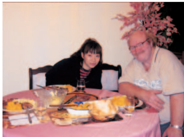
ホストファザーの作ってくれたバーベキュー (夕食)

今でもおそらく三週間のいつの日のことも覚えています。全てが新鮮で、毎日が特別でした。南十字星を見たこと、海でイルカを見れたことも、ただの買い物や散歩も、日本で感じる事のないものを感じさせてくれました。また、普段は考えないようなことを考えるいい機会でもありました。大変だったことも少しはあったけれど、行って良かったと本当に思います。おかげで日本の良さも改めて実感できました。