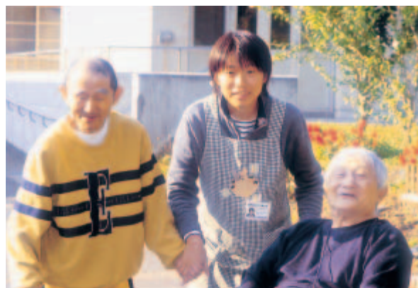
総合福祉センターなつどまり

今年度の実習は、昨年度の経験をふまえて実施した結果、概ね順調に経過し、10月中旬までに全員が無事終了し、現在、11月末の報告会に向けて準備を進めているところです。