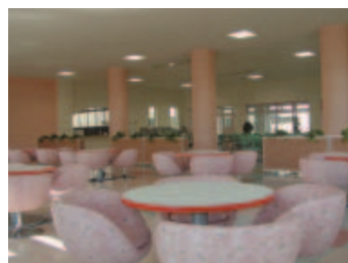
コミュニティホール