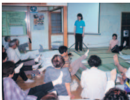
写真①/健康教育の1シーン 「骨粗しょう症を予防しよう」みんなで身体を動かそう

左下の写真は健康教育の一場面です。いつもは保健師が行いますが、この日は学生が指導案を作成し、教材を作り、住民を相手に悪戦苦闘していました。学生の緊張した面持ちに、「学生さん！若いんだからがんばれえ〜！」とゲキが飛びます。(写真①)