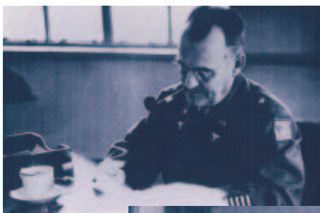
公衆衛生福祉局長サムス准将

この他に「日本の看護の法律」「青森県における保健婦の派遣制」「青森県における病院の看護サービスの変遷」「男性の看護への参画の歴史」などについても発表の予定ですので是非ご参加下さい。