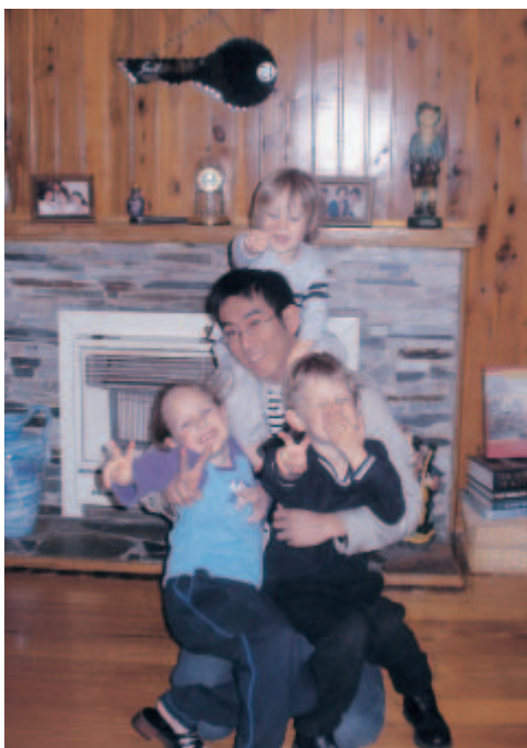
仲良くなった子供と最後の夜に

今回オーストラリアに行って、お互いに興味を持つということがコミュニケーションをとる上で重要なことだと思った。また、言語はコミュニケーションをとる手段の一つにすぎないということを感じることができた。しかし同時に、海外に行ったらやはり英語が必要だということも痛感した。もう一度オーストラリアに行く機会があれば、今度は十分に英語でコミュニケーションがとれるようにしたい。