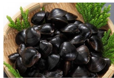
👑 2 シジミ