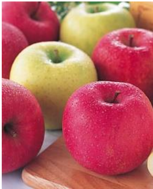
👑 1 りんご