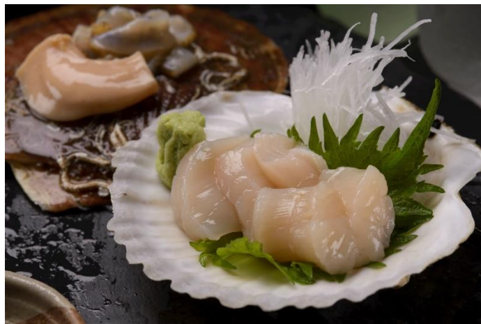
■ 陸奥湾ほたて（生でも焼いても）