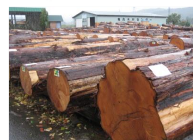
👑 1 ヒバ