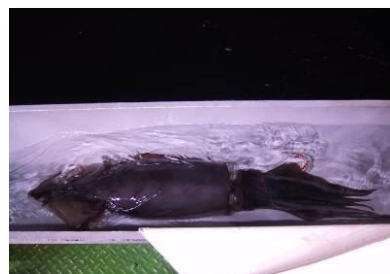
👑 1 いか類