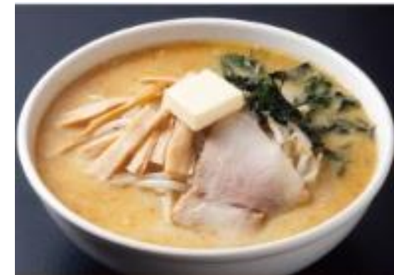
■ 味噌カレー牛乳ラーメン