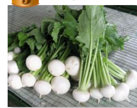
👑 3 かぶ