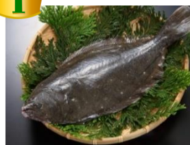
👑 1 ヒラメ