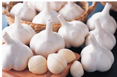
👑 1 にんにく