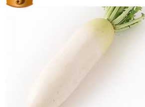
👑 3 だいこん