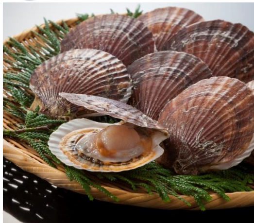
👑 2 ホタテガイ(海面養殖1位)