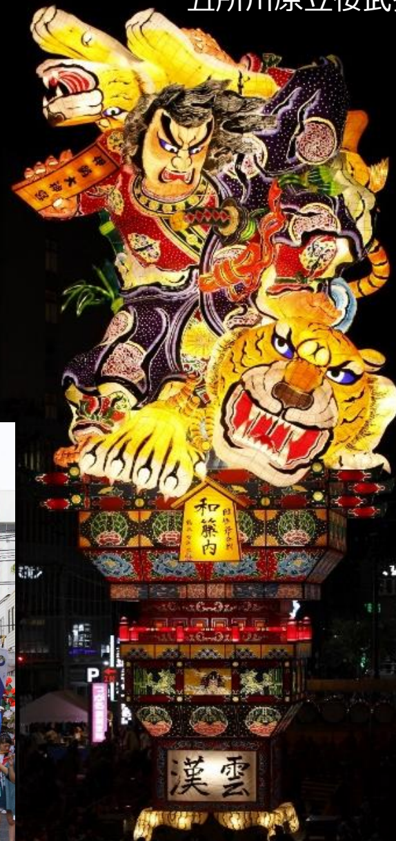
五所川原立佞武多