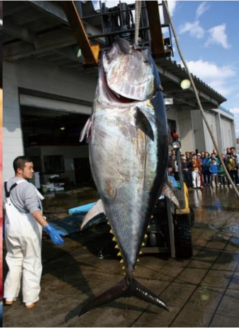
■ 本州最北端：大間のマグロ