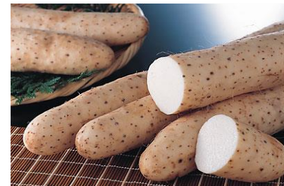
👑 2 ながいも