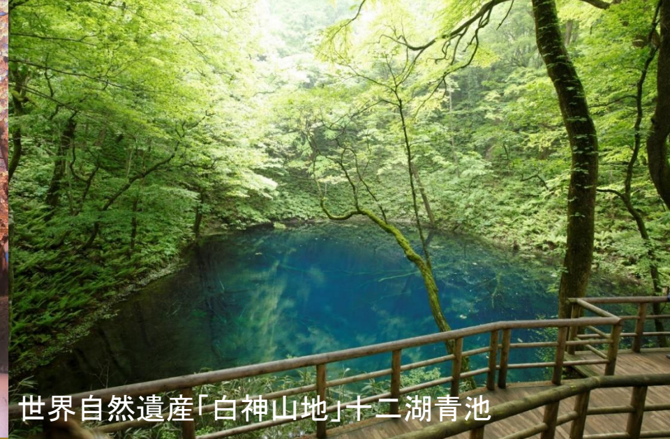
世界自然遺産「白神山地」十二湖青池