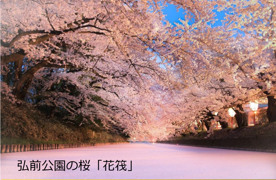
弘前公園の桜「花筏」