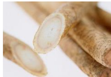
👑 1 ごぼう