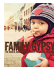
『ファミリー・ジプシー：家族で世界一周しながら綴った旅ノート』 高橋歩 A-Works 290.9||Ta33