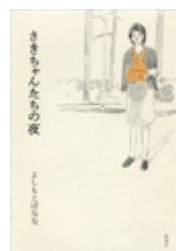
『さきちゃんたちの夜』 よしもとばな 新潮社 913.6||Y91

大学生活はたくさんやらなければいけないことも、自分でやりたいこともあり、時間が足りないくらいですが、今回ブックハンティングに参加し、久しぶりに本を読み、たまには、ゆっくり本を読んで過ごすのもなかなかよいものだなと思いました。他の学生がブックハンティングした本も読んでみようと思いました。大学の図書館は専門書が多いですが、ブックハンティングで様々な種類の本が増えていくといいなと思いました。自分が選んだ本を多くの人に読んでもらえるといいなと思います。みなさんも是非ブックハンティングに参加してみてください。