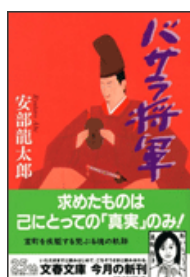
『バサラ将軍』 安部龍太郎 文春文庫 文藝春秋 913.6||A12