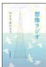
『想像ラジオ』 いとうせいこう 河出書房新社 913.6||I89

以上で選んだ本の紹介を終わります。ご協力頂いた保健大図書館の方々、成田本店新町店の方々、私が書いた文を読んでくれた方へこの場をお借りして謝辞を述べさせていただきます。ありがとうございました。