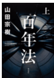
『百年法』上 山田宗樹 角川書店 913.6||Y19||1