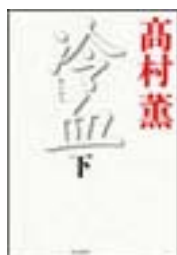
『冷血』下 高村薫 毎日新聞社 913.6||Ta45||2