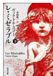
『レ・ミゼラブル』下 ヴィクトル・ユゴー著 永山篤一訳 角川文庫 角川書店 953.6||H98||2