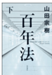
『百年法』下 山田宗樹 角川書店 913.6||Y19||2