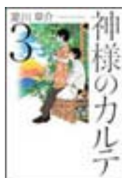
『神様のカルテ』3 夏川草介 小学館 913.6||N58