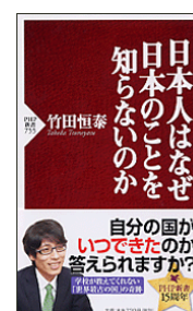
『日本人はなぜ日本のことを知らないのか』 竹田恒泰 PHP 新書 PHP 研究所 210.3||Ta59