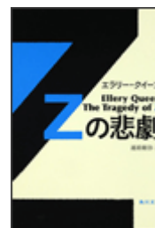
『Zの悲劇』 エラリー・クイーン著 越前敏弥訳 角川文庫 角川書店 933.7||Q3