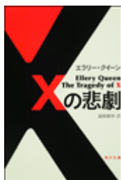
『Xの悲劇』 エラリー・クイーン著 越前敏弥訳 角川文庫 角川書店 933.7||Q3