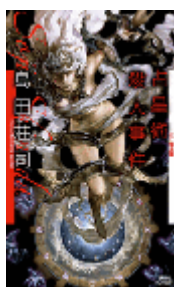
『占星術殺人事件』 島田荘司 講談社ノベルス 講談社 913.6||Sh36