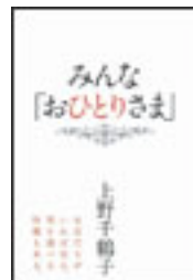
『みんな「おひとりさま」』 上野千鶴子 青灯社 367.75||J45