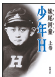
『少年 H』 上 妹尾河童 新潮文庫 新潮社 913.6||Se72||1