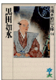
『黒田如水』 吉川英治 吉川英治歴史時代文庫 講談社 913.6||Y89