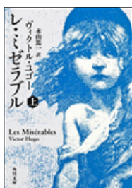
『レ・ミゼラブル』上 ヴィクトル・ユゴー著 永山篤一訳 角川文庫 角川書店 953.6||H98||1