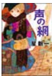
『声の網』 星新一 角川文庫 角川書店 913.6||H92