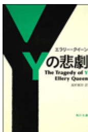
『Yの悲劇』 エラリー・クイーン著 越前敏弥訳 角川文庫 角川書店 933.7||Q3