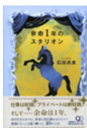
『余命1年のスタリオン』 石田衣良 文藝春秋 913.6||I72