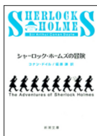
『シャーロック・ホームズの冒険』 コナン・ドイル著 延原謙訳 新潮文庫 新潮社 933||D89

全体的に見て今回のブックハンティングは、前回より内容が濃く、納得のいく選択が出来たと感じています。ですが、通販や取り寄せに対応できたらもっとたくさんの本が手に入るので、そういった対応がされていればもっと選択の幅が広がって良かったのではないかと思います。