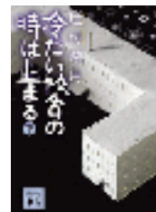
『冷たい校舎の時は止まる』下 辻村深月 講談社文庫 講談社 913.6||Ts44||2