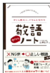
『敬語サクッとノート：すぐに使えて、きちんと伝える』 山岸弘子 永岡書店 815.8||Y23