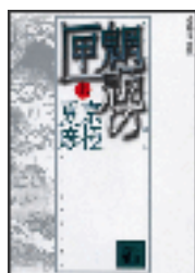
『煙燻の匣』上 京極夏彦 講談社文庫 講談社 913.6||Ky3||1