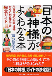
『「日本の神様」がよくわかる本：八百万神の起源・性格からご利益までを完全ガイド』 戸部民夫 PHP 文庫 PHP 研究所 172||To13