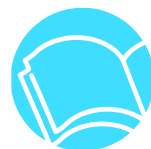
『マザー・テレサ語る』 マザー・テレサ述 ルシンダ・ヴァーデー編 猪熊弘子訳 早川書房 198.22||Th3