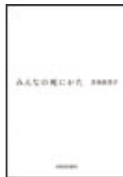
『みんなの死にかた』 青木由美子 河出書房新社 281||A53