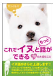
『これでイヌともしっかり話ができる: 70の大切なこと』 イヌマニア・琳 アース・スターエンターテイメント 645.6||I59