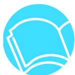
『ちいさいモモちゃん』 松谷みよ子 講談社文庫 講談社 913.6||Ma88