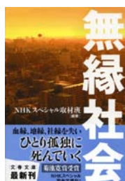
『無縁社会』 NHKスペシャル 取材班編著 文春文庫 文藝春秋 368||N69

6月某日、新町の成田本店へ出向いて友人と一緒に本を探しているときは、とても迷いました。事前に調べてあるといっても、お店に実際に並んでいなければ手に入りません。たくさん予算はあると思っていましたが、あれもこれも…と探して選んでいたら、あっという間に予算をオーバーしてしまって、諦めた本もありました。結局実際に欲しいと思って事前にリストア