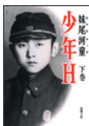
『少年 H』 下 妹尾河童 新潮文庫 新潮社 913.6||Se72||2