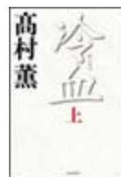
『冷血』上 高村薫 毎日新聞社 913.6||Ta45||1