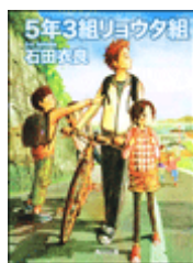
『5年3組リョウタ君』 石田衣良 角川文庫 角川書店 913.6||I72