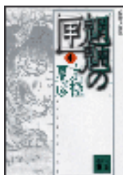
『煙燻の匣』中 京極夏彦 講談社文庫 講談社 913.6||Ky3||2