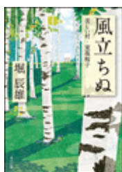
『風立ちぬ・美しい村・麦藁帽子』 堀辰雄 角川文庫 角川書店 913.6||H87