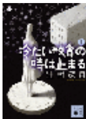
『冷たい校舎の時は止まる』上 辻村深月 講談社文庫 講談社 913.6||Ts44||1