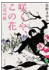
『咲くや、この花：左近の桜』 長野まゆみ 角川文庫 角川書店 913.6||N16