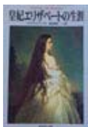
『皇妃エリザベートの生涯』 マルタ・シャート著 西川賢一訳 集英社文庫 集英社 289.3||Sc1