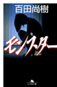
『モンスター』 百田尚樹 幻冬舎文庫 幻冬舎 913.6||H99

ップしておいたものは、一冊も手に入りませんでした。在庫が無いので取り寄せになると言われた本もありました。そういった本でも、取り寄せ後に受け取れるようにブックハンティングで対応してくれたら、もっと有意義に本を探ることができるのではないかと感じました。