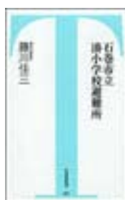
『石巻市立湊小学校避難所』 藤川佳三 竹書房新書 竹書房 369.31||F58