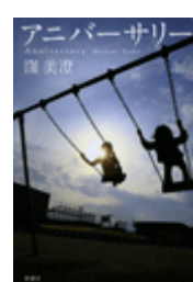
『アニバーサリー』 窪美澄 新潮社 913.6||Ku11