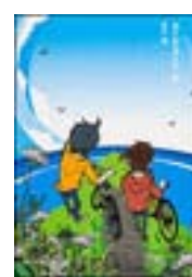
『県庁おもてなし課』 有川浩 角川文庫 角川書店 913.6||A71