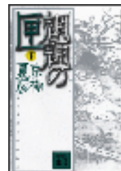
『煙燻の匣』下 京極夏彦 講談社文庫 講談社 913.6||Ky3||3