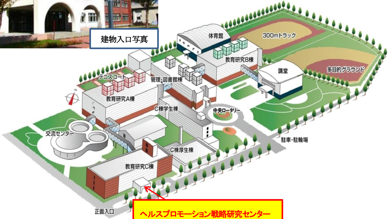
ヘルスプロモーション戦略研究センター (キャリア開発・研究推進課事務室)入口